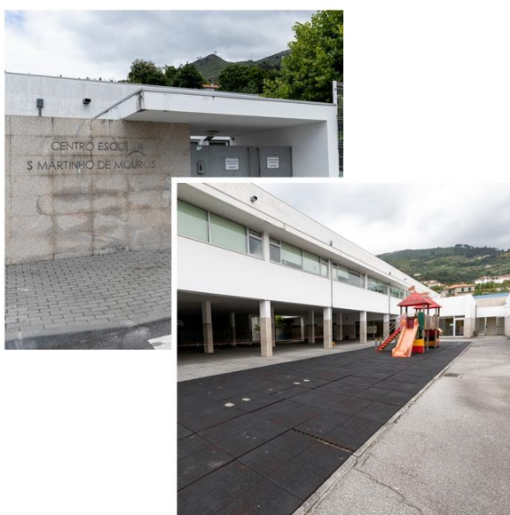
Figura 3- Centro Escolar de S. Martinho de Mouros