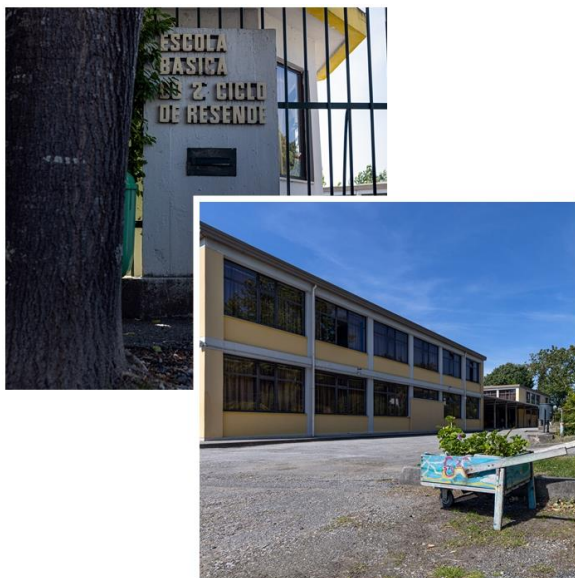
Figura 1- Escola EB2, D. António José de Castro