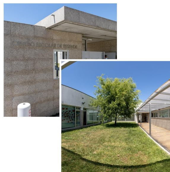
Figura 4- Centro Escolar de Resende